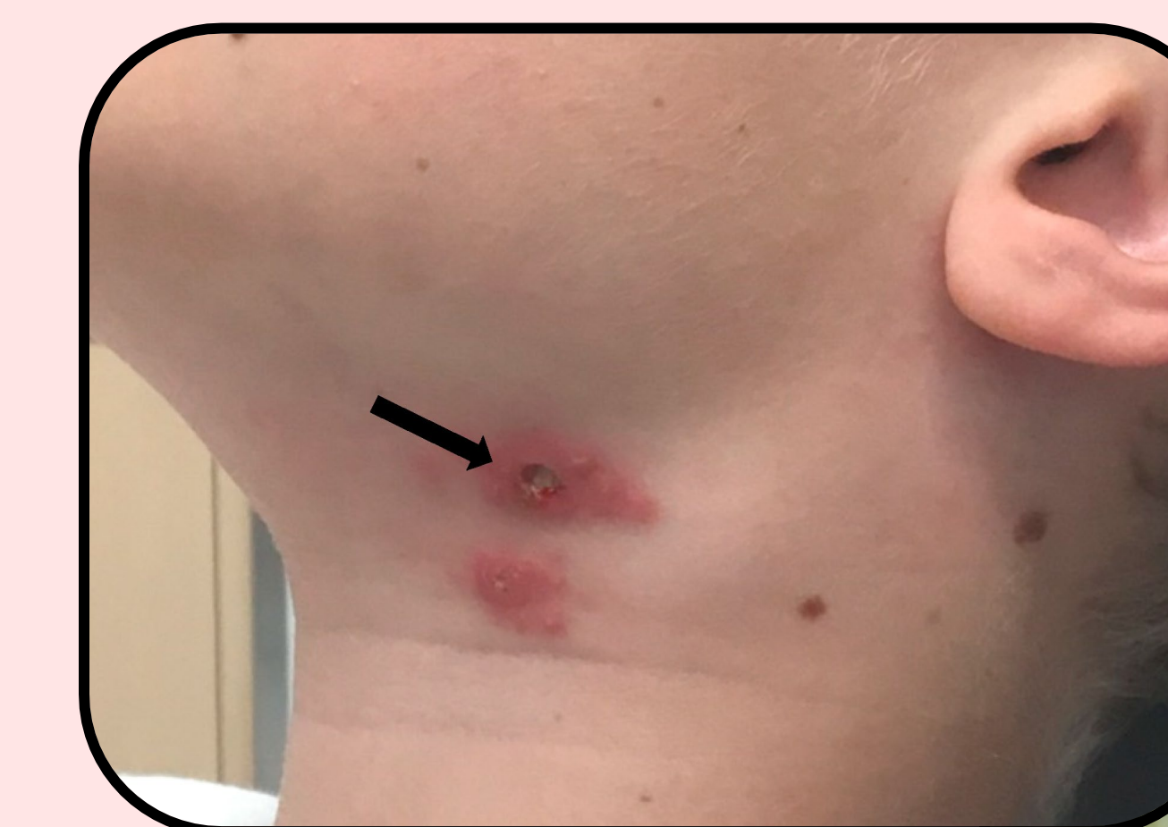
Isolation of Francisella tularensis from Skin Ulcer after a Tick Bite, Austria, 2020. Marcowicz 2021

Harepest kan slå harer ihjel, men inden da kan sygdommen være overført til flåter, som derefter kan føre den videre til mennesker.